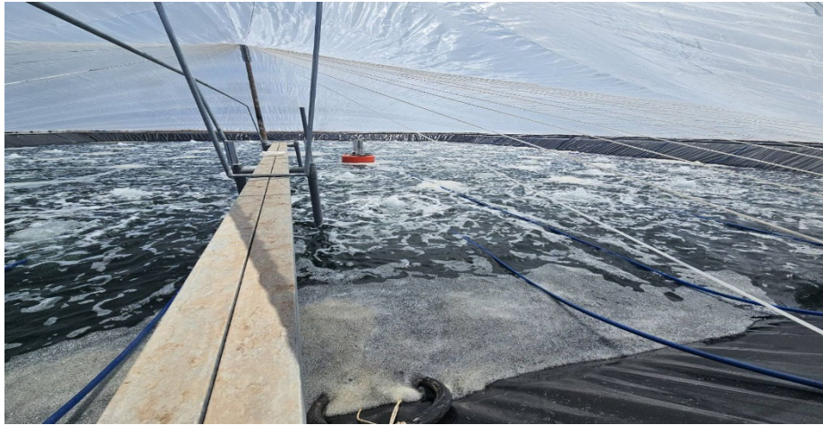
写真 1 実証サイトのエビ養殖池